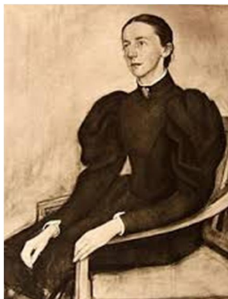
Matilda Wrede (1864 – 1928) vankeinhoidon edistäjä