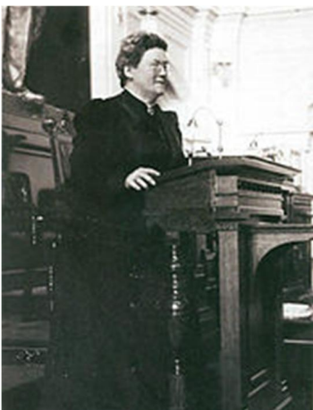
Alexandra Gripenberg (1857 – 1913) naisasialiikkeen uranuurtaja