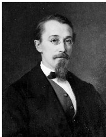
Yrjö-Sakari Yrjö-Koskinen (1830 – 1903) suomalaisuusmies