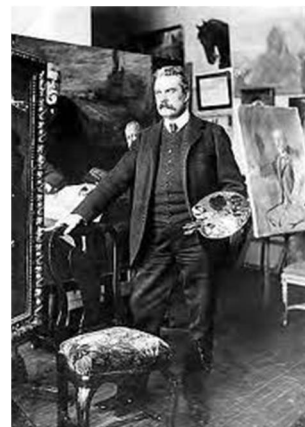
Albert Edelfelt (1854 – 1905) taidemaalari